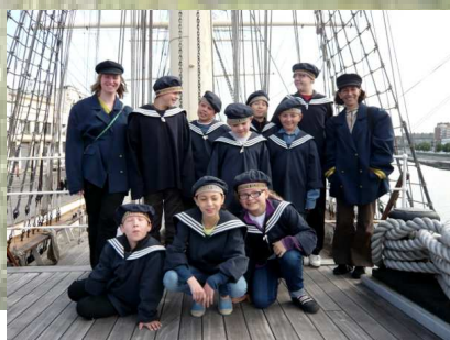
L'équipe de la classe Louis Pergaud